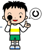
視力検査の結果 A判定の割合